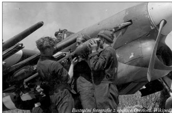
Ilustrační fotografie z operace Overlord