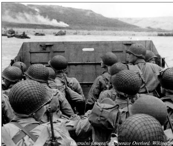
Ilustrační fotografie z operace Overlord

Poznámka: vojáci neuvedení v kronice jsou evidováni podle domovského práva ve Vojském historickém ústavu