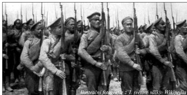
Ilustrační fotografie z 1. světové války

Z tabulky na další straně je patrné, kde se ocitli muži, kteří se do války dostali z naší obce.