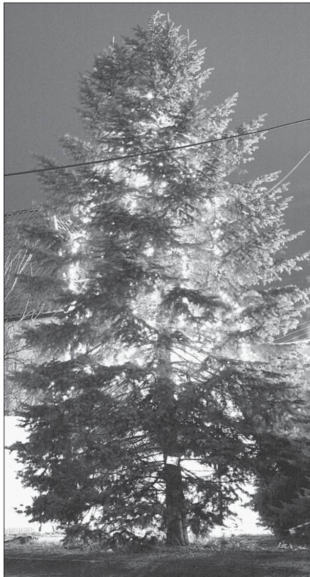
Autor Jiří Grégr

● Na veřejném zasedání se projednávala žádost manželů Nedvědových o udělení výjimky z územního plánu obce týkající se tvaru střechy (pultová) , který není v souladu s ÚP. Zastupitelstvo výjimku neschválilo. -gp-