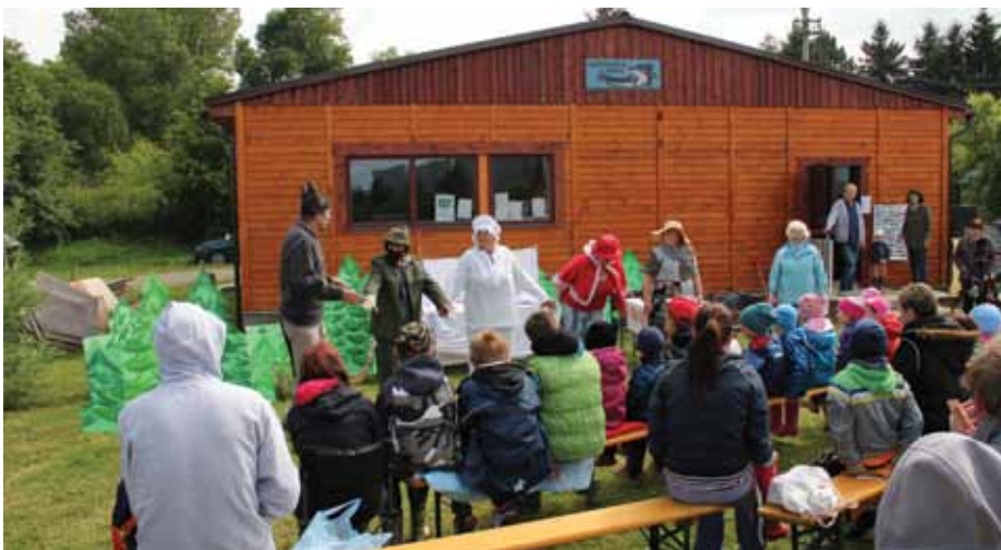
První divadelní představení spolku ARBOR

V květnu jsme zrealizovali na OÚ výstavu „Staročeské máje v Chýni ve fotografii“. Nechyběla ani májka ani tančící pár v krojích. Děkujeme všem za zapůjčení fotografií.