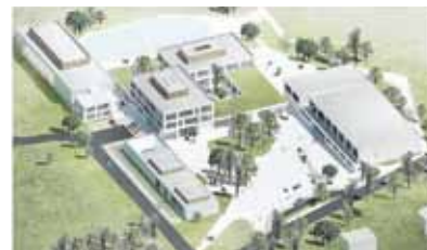
Vizualizace vítězného návrhu