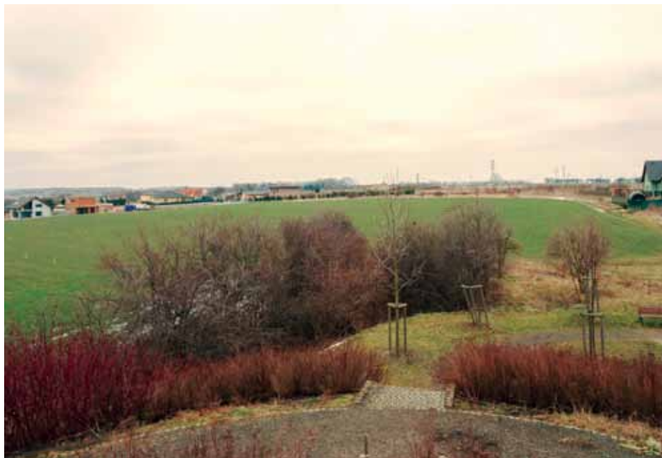
Pozemek, na kterém by v roce 2017 měla stát nová škola