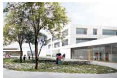
Vizualizace vítězného návrhu