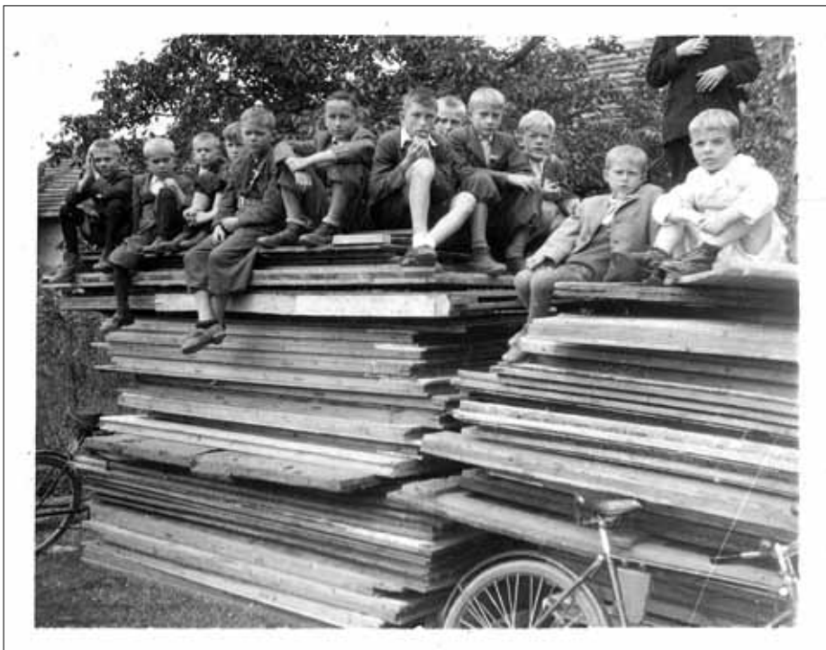
Na fotografii sedí chlapci, kteří vzpomínali na svoje zážitky z konce války. Dřevěné dily pocházejí z rozebrané ubikace, kterou měli Němci na palpostu.