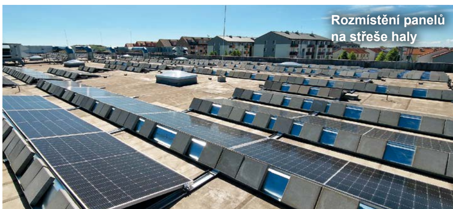
Rozmístění panelů na střeše haly

se stala společnost EGE Power System, s.r.o., která dodala a instalovala zařízení včetně akumulčního systému, rozvodny NN i kompletní technologie řízení výroby a spotřeby.