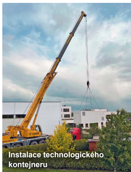
Instalace technologického kontejneru

Samotná realizace projektu byla zahájena v roce 2024. Dodavatelem stavby