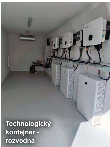
Technologický kontejner - rozvodna

U haly je instalován nový technologický kontejner - rozvodna NN, který zajišťuje bezpečné a přehledné zapojení systému. Jsou zde umístěny střídače a baterie.