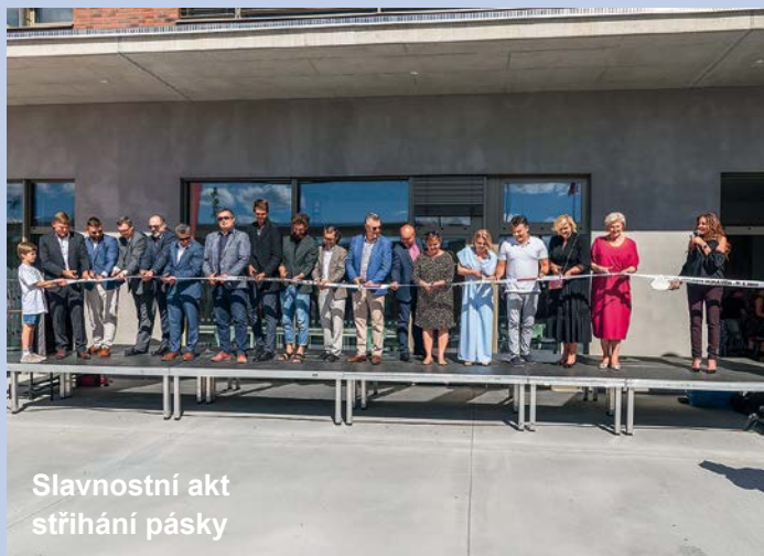
Slavnostní akt stříhání pásky