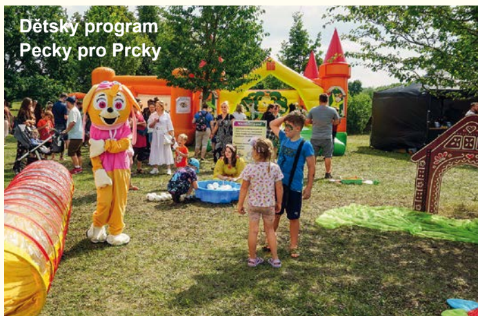
Dětský program Pecky pro Prcky